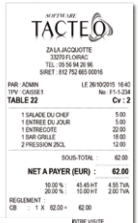
Tickets et factures paramétrables